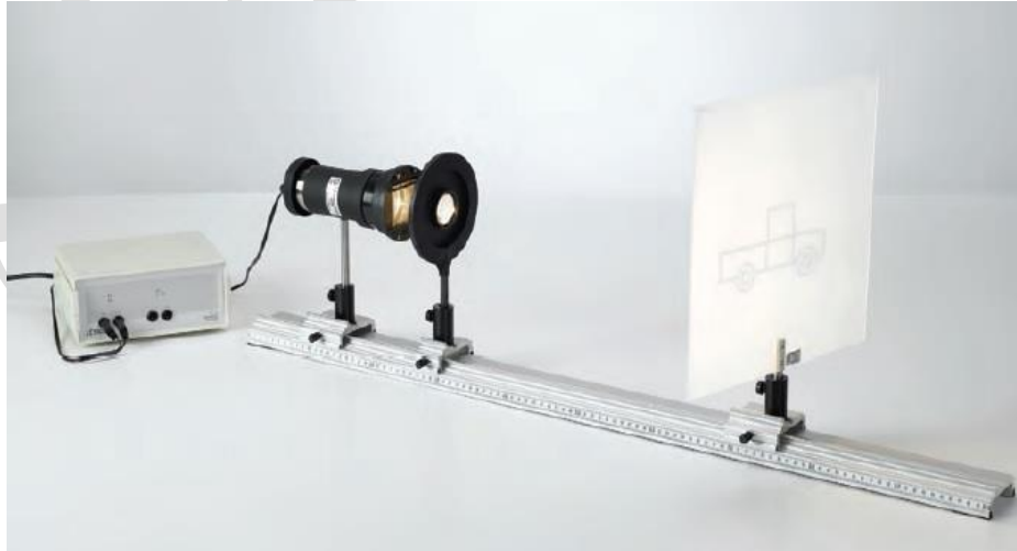
الشكل (1): الأجهزة المستخدمة في تجربة تحديد البعد المحرقي لعدسة مقربة باستخدام طريقة بيسل.

حيث أن s هو البعد ما بين المصباح واللوح.